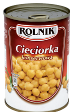
CIECIORKA KONSERWOWA / Chickpea