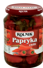
PAPRYKA CHILLI / Chilli pepper