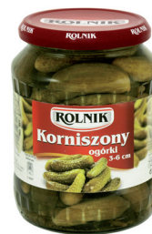
OGÓRKI KORNISZONY 3-6 cm / Pickled cucumbers

Kod EAN: 5 900 919 000 267 Kod EAN: 5 900 919 000 045