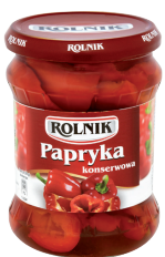
PAPRYKA KONSERWOWA ĆWIARTKI / Pickled red pepper quarters

Kod EAN: 5 900 919 000 274 Kod EAN: 5 900 919 000 113