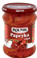
PAPRYKA CIĘTA / Sliced pepper