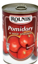
POMIDORY CAŁE OBRANE W SOSIE WŁASNYM / Peeled tomatoes in own brine

Kod EAN: 5 900 919 004 548 Kod EAN: 5 900 919 000 298