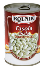
FASOLA KONSERWOWA BIAŁA / White beans