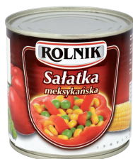
SAŁATKA "MEKSYKAŃSKA" / MEXICAN salad