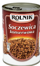
SOCZEWICA KONSERWOWA / Lentils