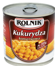
KUKURYDZA KONSERWOWA / Sweetcorn