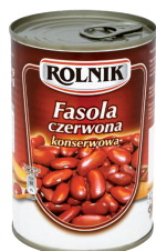
FASOLA CZERWONA / Red kidney beans