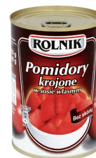
POMIDORY KROJONE W SOSIE WŁASNYM / Chopped tomatoes in own brine