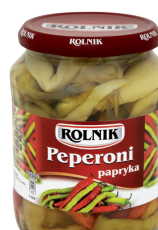
PAPRYKA PEPERONI / Pepperoni pepper