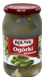
OGÓRKI KWASZONE / Sour cucumbers