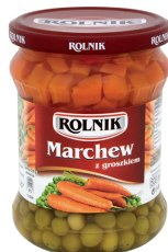
MARCHEW Z GROSZKIEM / Carrot with peas