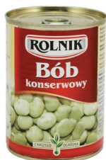
BÓB KONSERWOWY / Broad bean