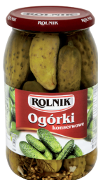
OGÓRKI KONSERWOWE / Pickled cucumbers