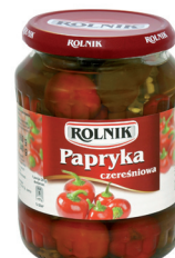
PAPRYKA CZEREŚNIOWA / Cherry pepper

Kod EAN: 5 900 919 000 137 Kod EAN: 5 900 919 000 120 Kod EAN: 5 900 919 000 151