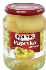
PAPRYKA JABŁKOWA / Apple pepper