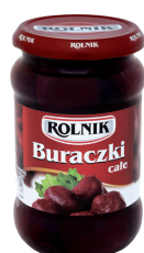
BURAKI KONSERWOWE CAŁE / Baby beetroots