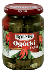
OGÓRKI Z CHILI / Cucumbers with chilli peppers