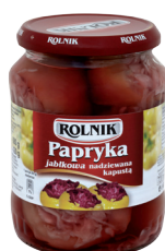
PAPRYKA JABŁKOWA NADZIEWANA KAPUSTĄ / Apple pepper stuffed with cabbage