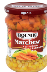
MARCHEW Z GROSZKIEM I KUKURYDZĄ / Carrot with peas and sweetcorn