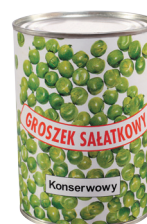
GROSZEK SAŁATKOWY / Salad peas