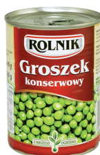
GROSZEK KONSERWOWY / Green peas